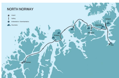
Ski & Sailing in Norvegia: Tromso - Alta