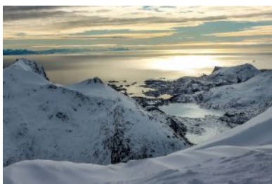
Vista su Svolveer dal Tuva - Lofoten, Norvegia

Alla latitudine di 68°N circa, più o meno fra Narkiv e Harstad, una penisola ad arco con molte isolette e fiordi , si protende dalla ideale linea di costa della Norvegia per 150-200 km nell'oceano, facendo barriera e proteggendo il Vestfjorden dai venti e dalle onde impetuose dell'Oceano Artico. Proprio per questo la costa sud è più protetta e popolata, caratterizzata da piccoli villaggi dalle casette rosse o bianche, isolate o raggruppate in piccoli agglomerati. Sono collegate fra loro da strade tortuose con ponti o tunnel sottomarini, e spesso si affacciano sul mare, dove un piccolo pontile consente l'attracco di barche a motore. Talvolta, la strada non le raggiunge affatto, e l'accesso è possibile solo dal mare.