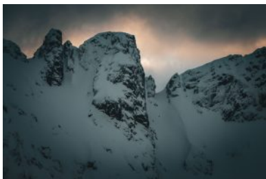
Couloir in Trollfjorden - Lofoten, Norvegia

Benché vi siano diverse cime facilmente accessibili e sciabili, e che sono apprezzate soprattutto nel periodo invernale, i ripidi fianchi dell' Higravtind , del vicino Geitgallien e del Trollsdalen (solo per citarne alcuni ben visibili e vicini a Svolveer) fanno facilmente immaginare linee ripide lungo canali e pendii adatti a provetti sciatori.