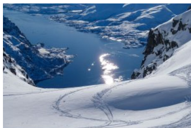
Ingresso al Geitgallien South Gully – Lofoten, Norvegia