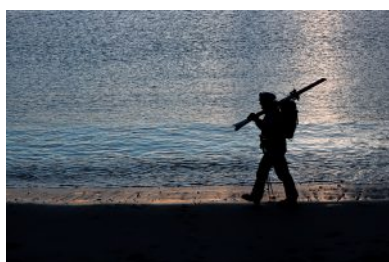
Fine gita, ultimi passi lungo la spiaggia - Norvegia, Lofoten

Le gite che affronteremo partono dal livello del mare o poco lontano da esso e salendo quasi sempre si vedono i fiordi con mille riflessi di luce.