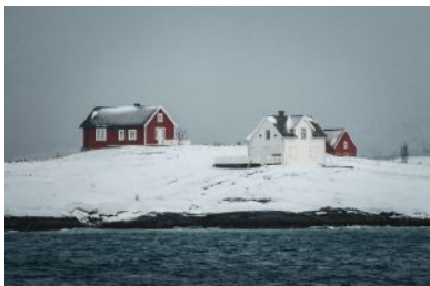
Tipico paesaggio norvegese

Per il nostro viaggio di Scialpinismo in Norvegia – Tromso & Lyngen abbiamo scelto Tromso quale base delle nostra attività, nel Nord della Norvegia.