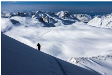
Nel silenzio e nella solitudine

Le giornata inizia con la sveglia di solito verso le 7.30 e la colazione, in modo di partire da Tromso verso le 8-8.30, a seconda della destinazione.