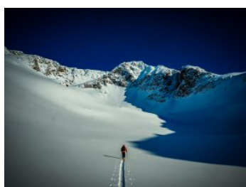
Salendo in un vallone solitario

Le vette che potremo salire hanno nomi che evocano i Vikinghi: