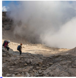
inMont Trekking Pelmo