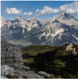
inMont Trekking Pelmo 01

Per info: info@inmont.it Link: https://inmont.it/tours/pelmo-cengia-di-ball/